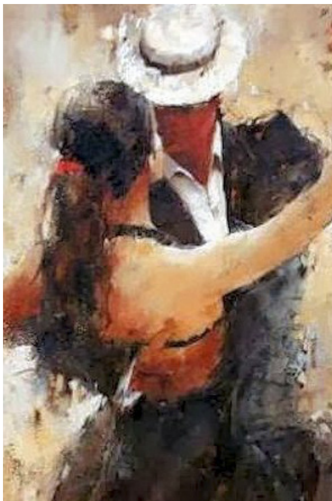
Bessenyei Sándor Tánc (részlet)

Táncolni ketten, Táncolni a végtelenben, Táncolni egy életen át, Táncolni mindenben át,