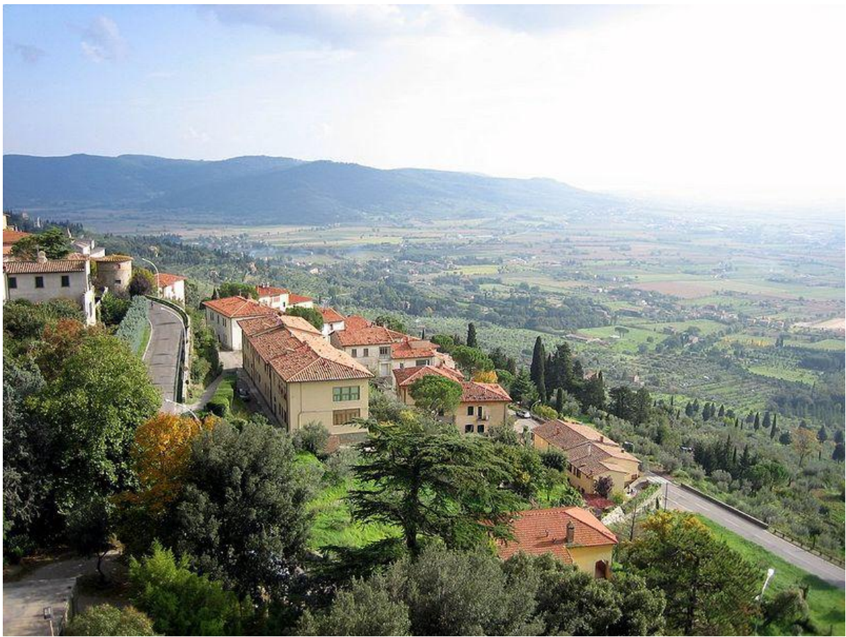
Cortona látképe napfényben