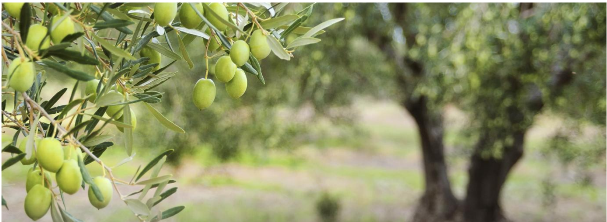
Toszkána zöld aranya, az olívabogyó