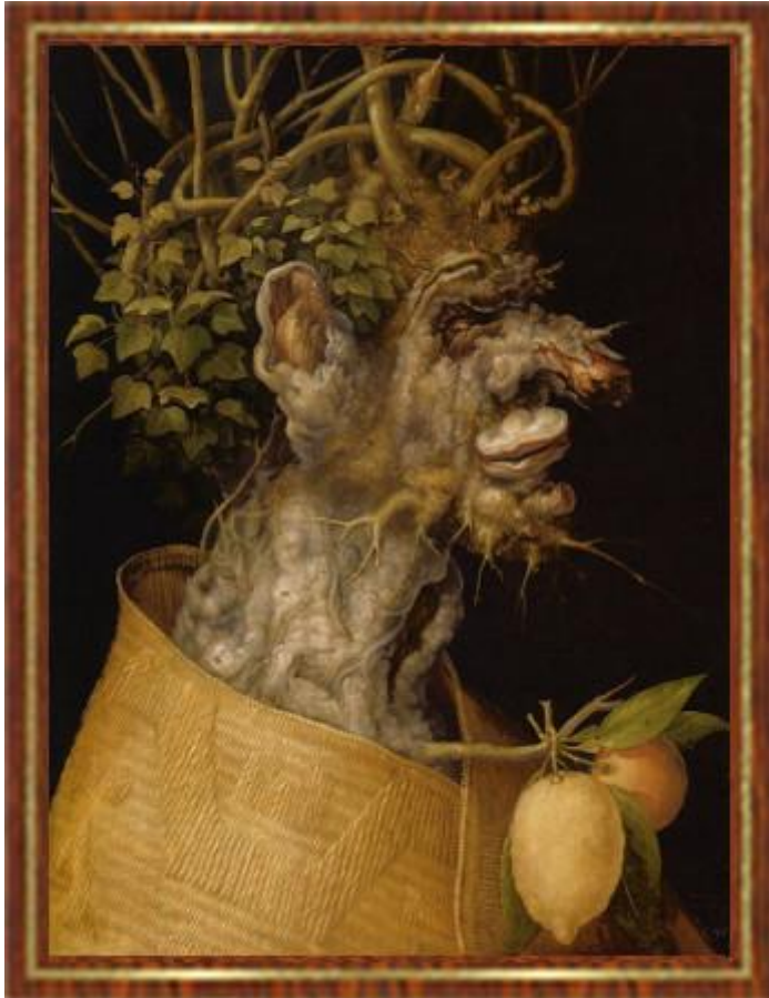
Giuseppe Arcimboldo: A négy évszak - tél, 1563

Az idő nem magnószalag, amit oda-vissza lehet tekerni. (...) Az idő itt van. Használd ki.