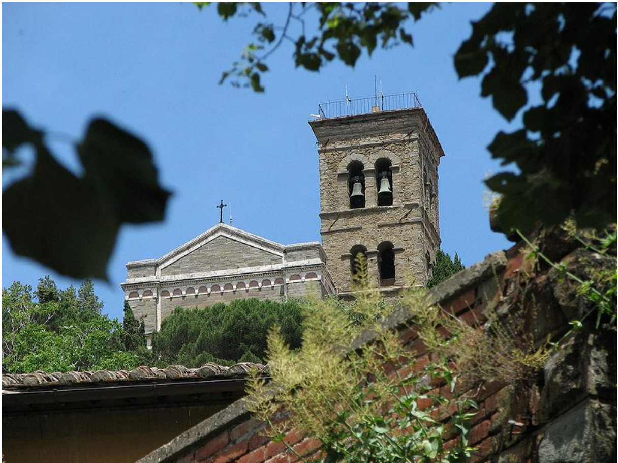
Cortona, A Santa Margherita templom harangtornya