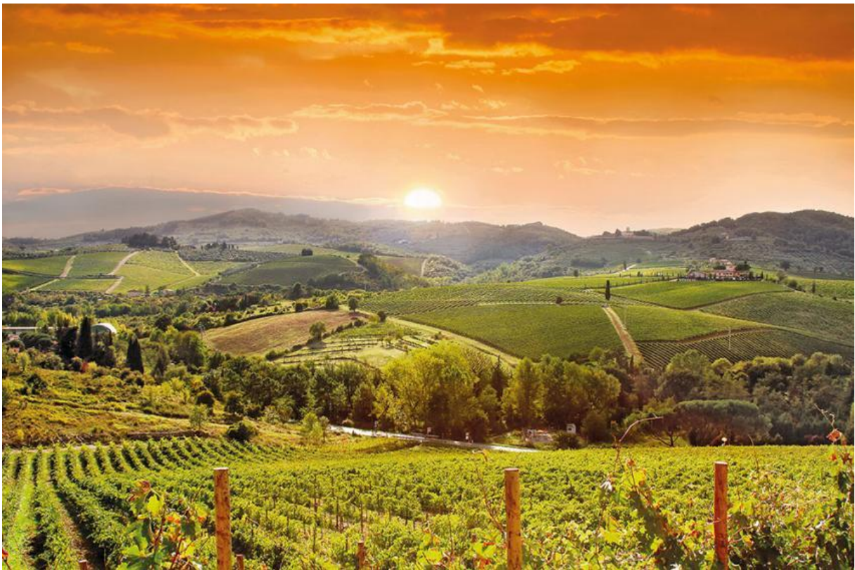
Toszkán táj ragyogó napsütésben