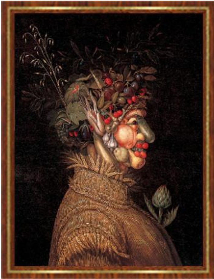
Giuseppe Arcimboldo: A négy évszak - nyár, 1572

Az idő (...) olyan lassan telik, amíg az ember fiatal, idősebb korunkban pedig olyan, mintha röpkülne.