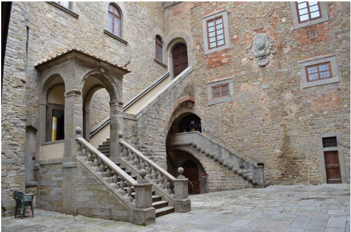
Cortona, Etruszk Múzeum

És a nagy etruszk talány, amiről annyit beszéltek? Azok a híres halálközönségek? Hol vannak? Seholy látom, bármerre nézek a sírok, vázák és ábrák, az égetett föld alakzatai között, csak az életet, és benne az alvilági szörnyeket is persze, mert nagy dolog a halál. De nagyobb dolog kifogni a halálon és nincs szebb képlete, mint a nevetés.