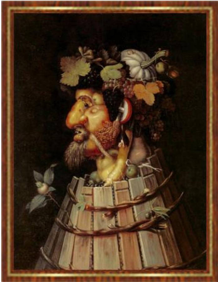
Giuseppe Arcimboldo: A négy évszak - ősz, 1572

Az idő, amiről jobb, ha nem kérdezzük, micsoda, egyre gyorsabban telik. Múlik. Száguld.