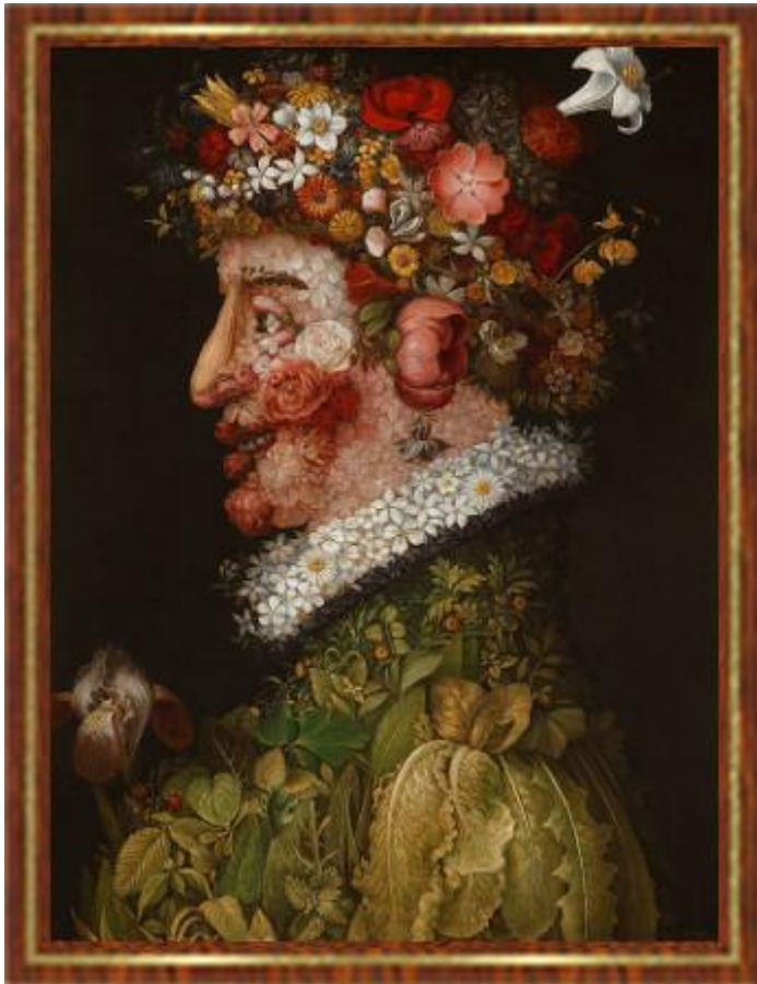
Giuseppe Arcimboldo: A négy évszak - tavasz, 1563

Az idő múlása arra szolgál, hogy az ember lehetőséget kapjon a fejlődésre, hogy bölcsébbé váljon, kiteljesítse önmagát.