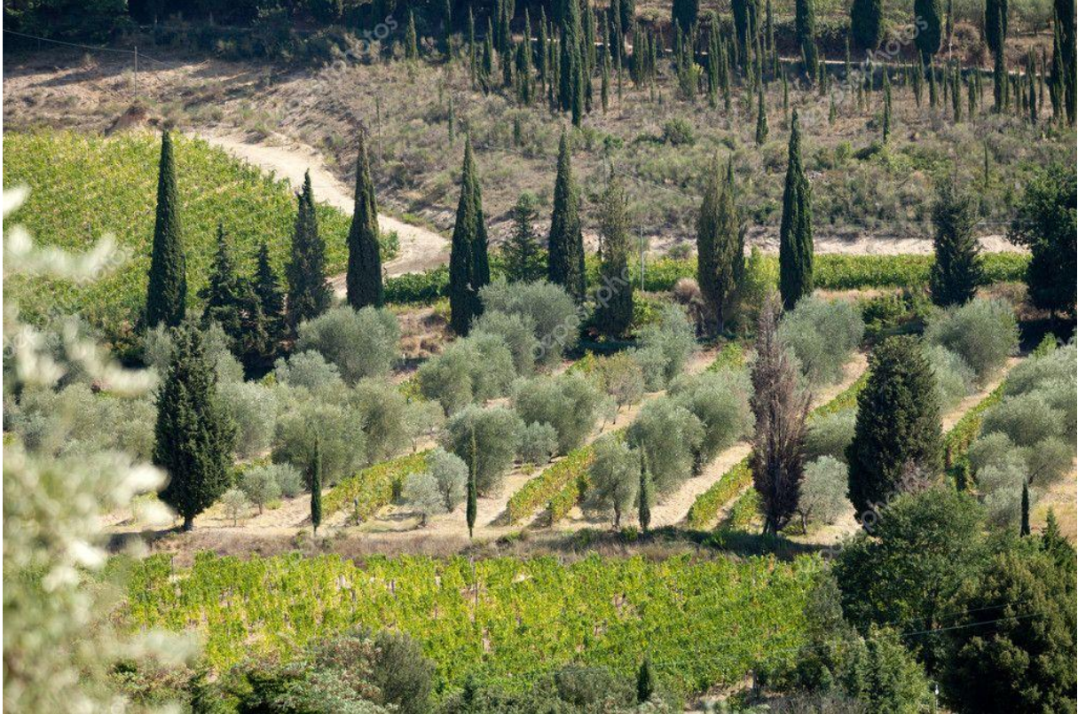
Toszkán táj olajfákkal