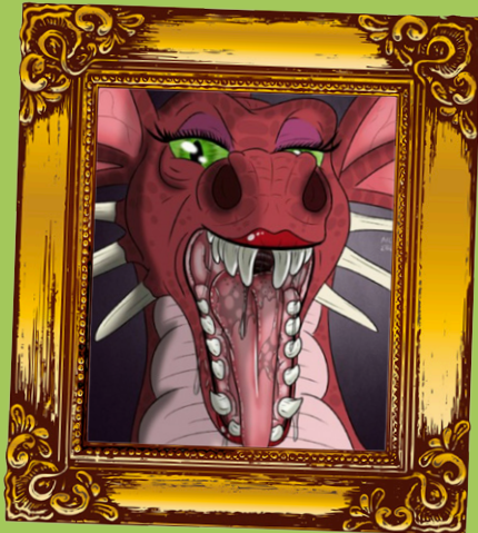
Weöres Sándor A hétfejű sárkány

Iszapos tóból száz karika száll, a hétfejű sárkány odalenn pipál, folyton füstöl, hét fekete szája, fűzfagyökérből hét öblös pipája, békalencséből vágott dohánya, vízitök-levélből hét hálósapkája. Amikor haragos, kavarog a katlan, hét pipakupakja nagyot csattan.