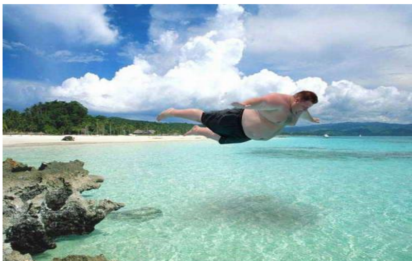
Szállj, szállj, szállj fel magasra... ( Piramis )