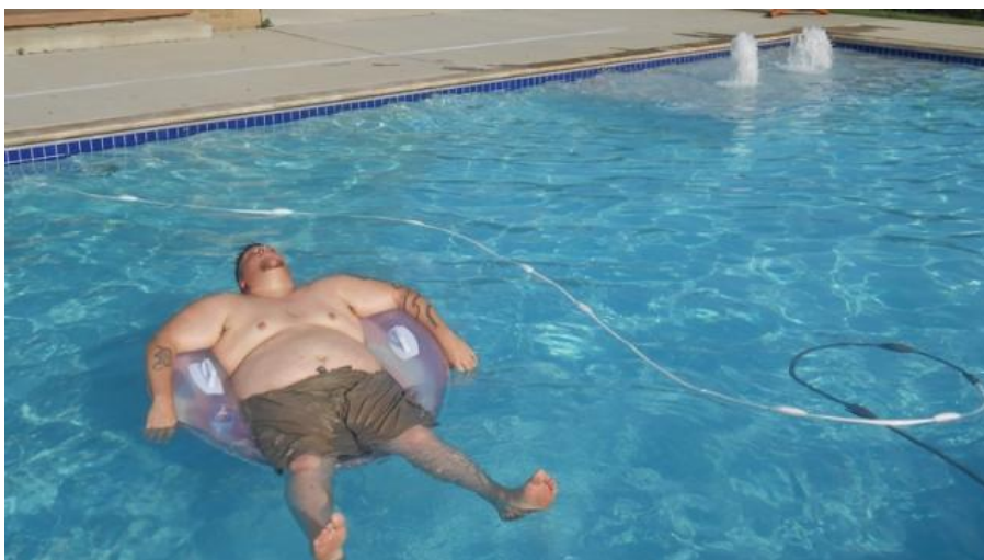
Csepp a tengerben (Jazz + Az)