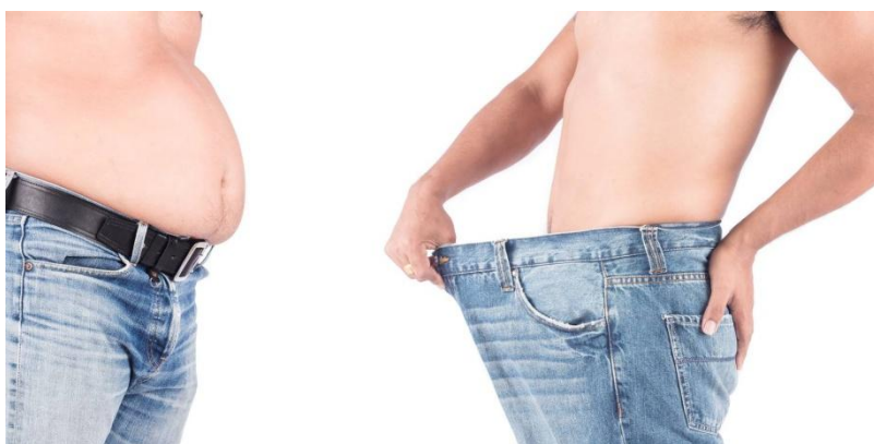
Nekem mindenem a farmerem... olyan jól feszül az mindenem ( Delhusa Gjon )