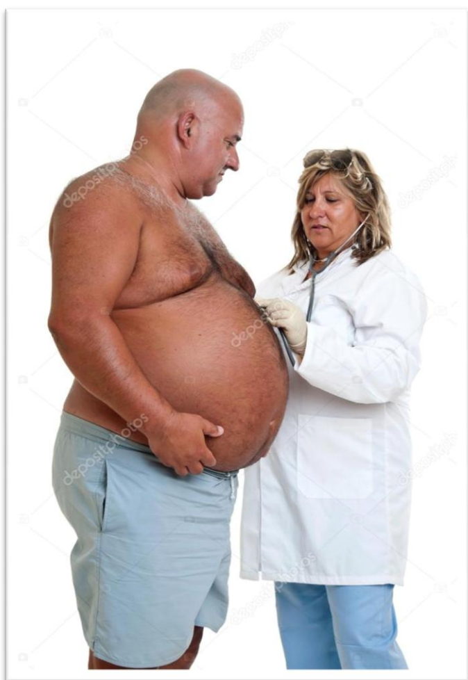
Orvost hívjál, ha baj van, én segítek minden bajban! Hasad, ha fáj, nem akadály (Gryllus Vilmos)