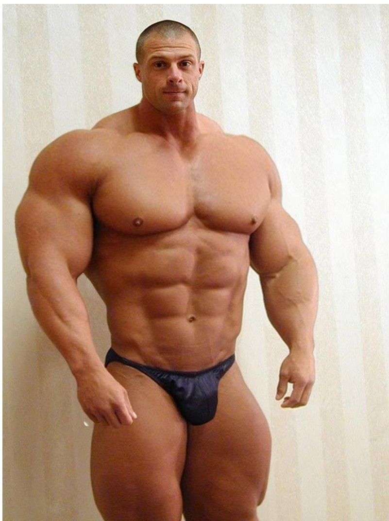
Álmodtam egy világot magamnak ( Edda )