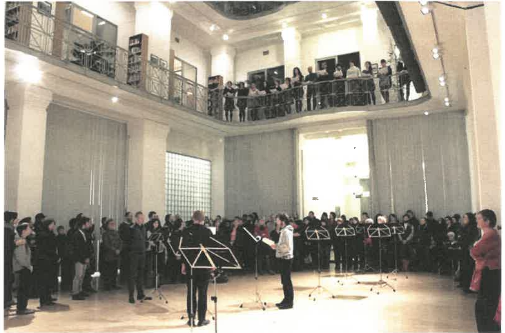
Hamis vallomás című kiállítás megnyitó performansza. Centrális Galéria, 2013. november 14.

...Cinege, féreg, ember: egy-kutya, Mind közös áldozata A hatalmas dühnek, Mely, míg megöl, Utódot csikar ki áldozatából, Hogy azt is megölje. Tán van valahol simább világ is És vár reánk? De mért jutottunk e keserves gödörbe, Mit vétettünk, Ember, féreg, cinege? E világ mikor szünteti be Folytonos, förtelmes kloakáját, Hol szétrágott étel, rothadt szivom, Kőtörmelék, madártoll, Babylon, Hulla, okádék, álom Hömpölyög egy-folyáson? Hol a torkolata? Gyerünk innen haza!